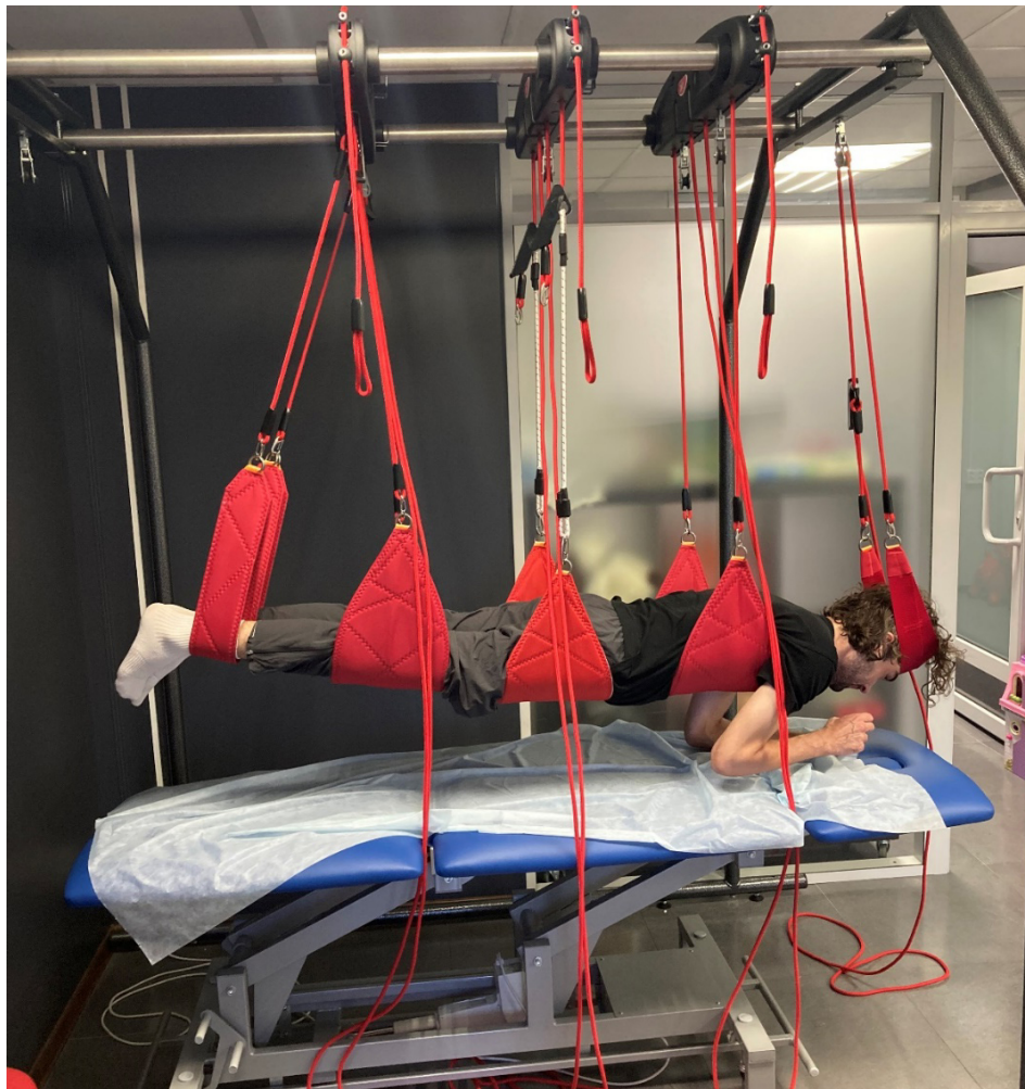
Рис. 1. Использование подвесных систем по концепции NEURAC

«порог», который может быть болезненным при прикосновении к нему [1].